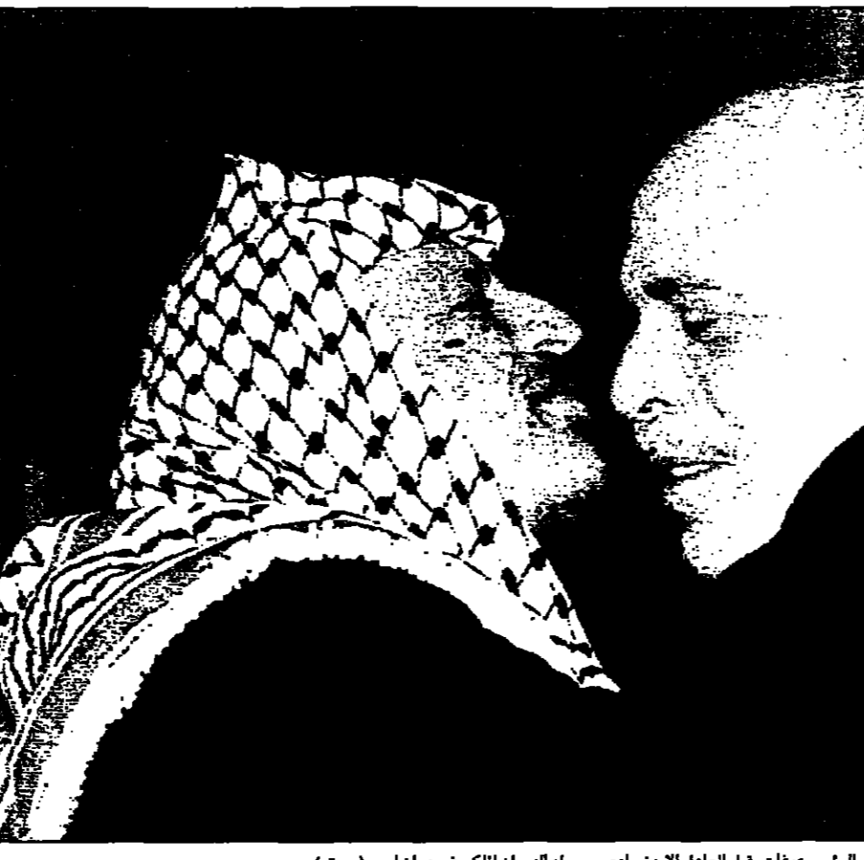
الرئيس عرفات يقابل العامل الأردني لدى وصوله اليونان الملكي في عمان أمس

غزة - الف: في لقاء مع مسؤولين إسرائيليين، أكد الملك حسين في حديثه مع مسؤولي الخارجية الإسرائيلية، أن المرحلة النهائية من إعادة الانتشار الإسرائيلي حاسمة. وتأتي هذه الجهود في إطار حرص الجانبين على تحقيق السلام والاستقرار في المنطقة.